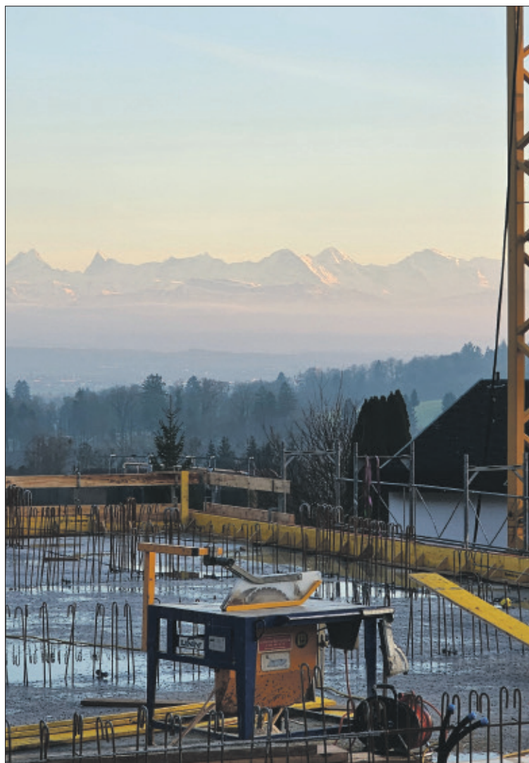
In den Obergeschossen bietet sich diese unverbaubare Aussicht auf die Berner Alpen. Einzigartig ist auch der ebenfalls unverbaubare Ausblick auf den Jura mit der imposanten Balmfluh.

Die Überbauung Greenwil am Jura-südfuss verbindet das Beste aus zwei Welten: Die Ruhe und Grosszügigkeit eines Einfamilienhauses sowie den Komfort einer modernen Eigentumswohnung. Die Süd-/Südwest-Ausrichtung mit Blick auf Alpen und Jura, grossen Terrassengärten, hellen Räume und keinerlei Durchgangsverkehr schaffen eine Wohnqualität, wie man sie heute nur noch selten findet.